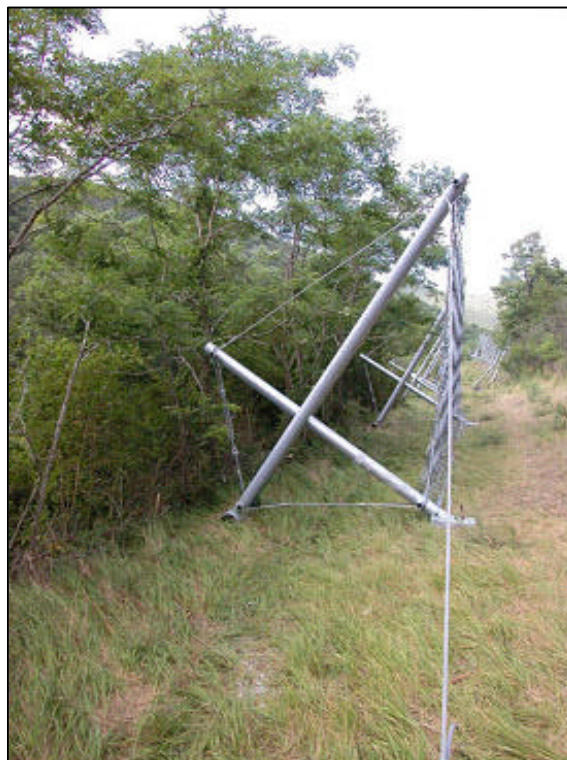
Ecran parepierres Xcross 500 kJ