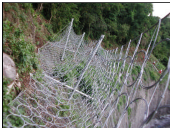
Ecran parepierres Xcross 200 kJ